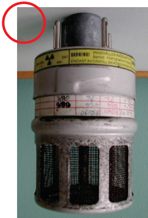
Billede 4: Kategori 1 røgdetektor med typebetegnelsen IA-130 (symbolet for ioniserende stråling findes på bagsiden).