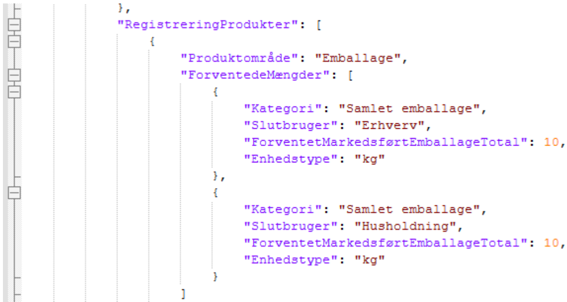
Figur 1 – Samlet emballage

Forhåndsregistrering af emballageproducenter kan ske for Samlet emballage (figur 1), hvis de forventede mængder totalt er under 8 ton. Ellers skal mængderne fordeles pr. kategori (figur 2). Genbrugsemballagekategorier tilføjes under produktområdet emballage. Se gyldige værdier i tabellen 'Kategorier'.