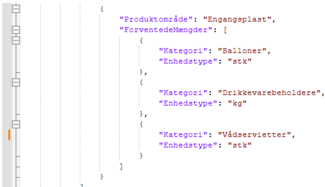
Figur 3 - registrering af engangsplast

Ved registrering af engangsplastproducenter skal der ikke angives forventede mængder. Struktur følger eksempel i figur 3.